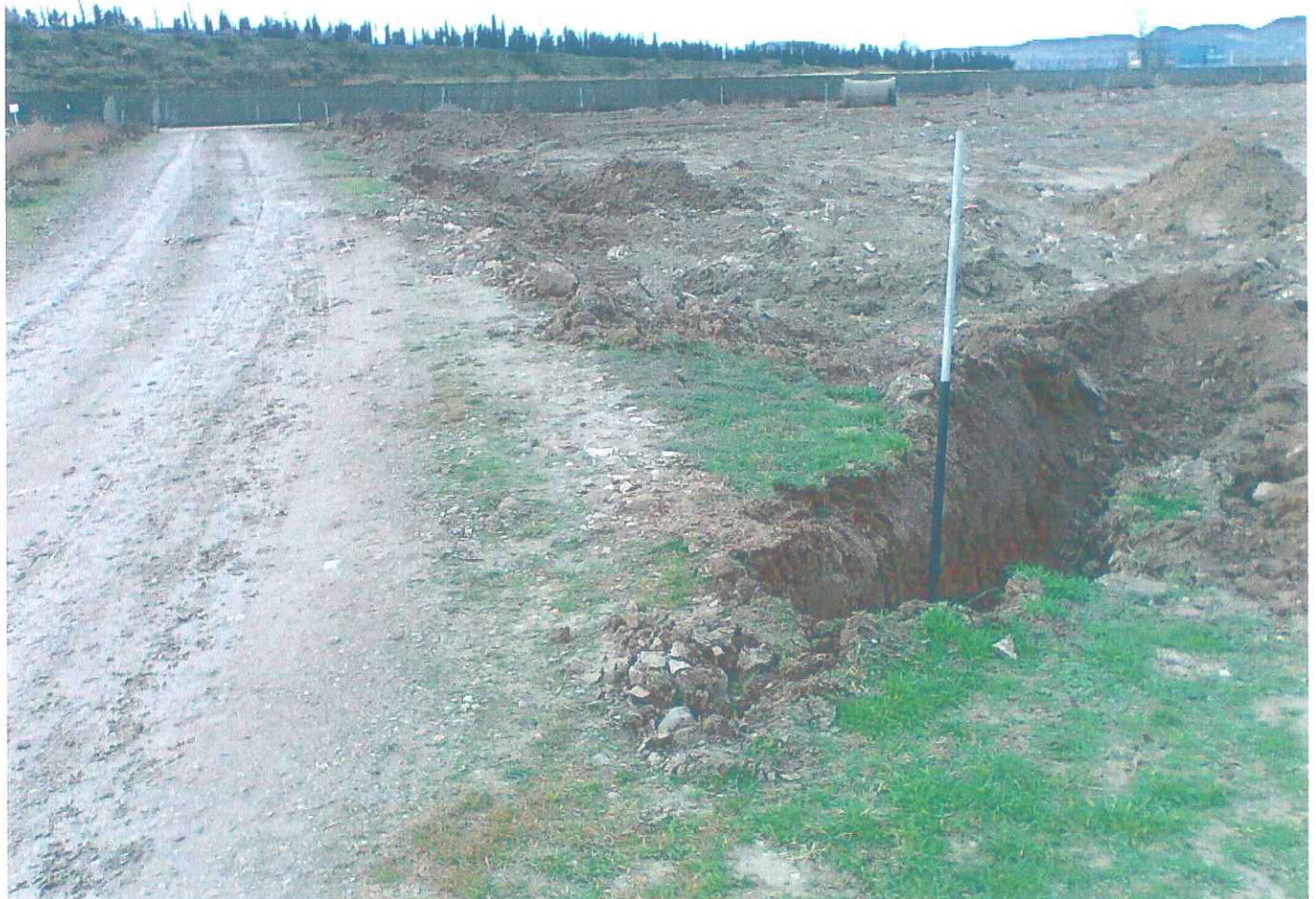
Interrupción de la continuidad del camino por la nueva acequia de la Vislada.